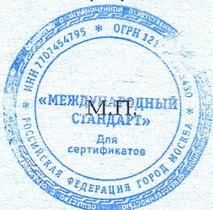
Схема сертификации: 3с.